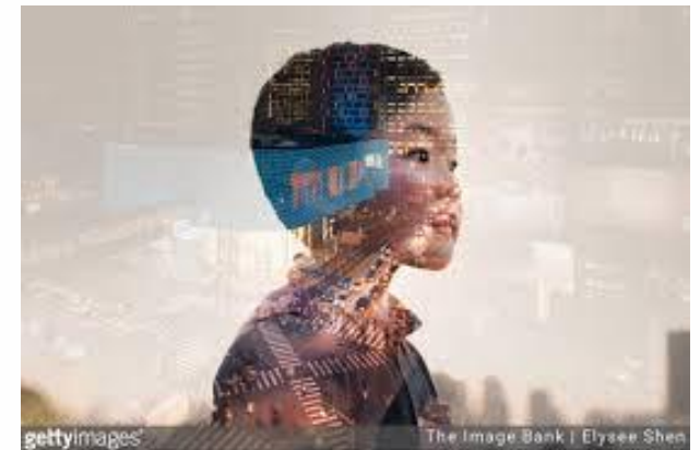
A preocupação com o futuro