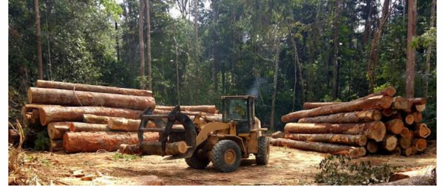
Lei de destruição e ação do